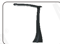
Lampa biurkowa LED