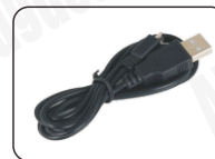
Przewód zasilający USB